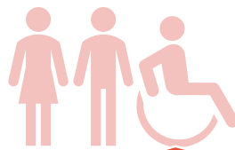
Insel der Gesundheit