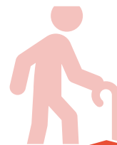
Insel der Generationen