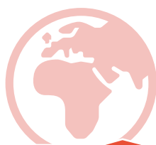
Insel der Herkunft