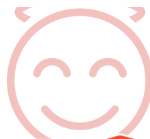
Insel des Glaubens