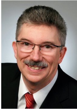
Sehr geehrte Damen und Herren,

Fachkräftemangel begegnen, Mitarbeiter binden und Führung stärken sind die wichtigsten Herausforderungen für Personalentwickler. (HR-Trend-Studie 2014 des Geva Instituts im Auftrag des BPM)